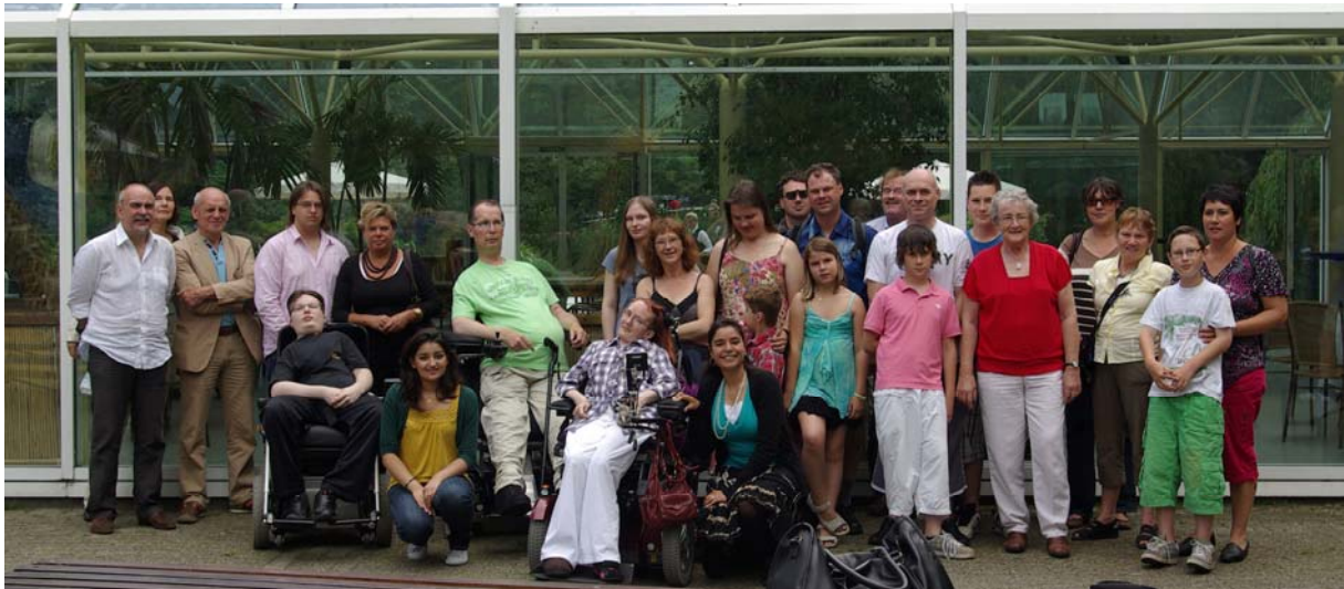
lotgenotendag in Artis